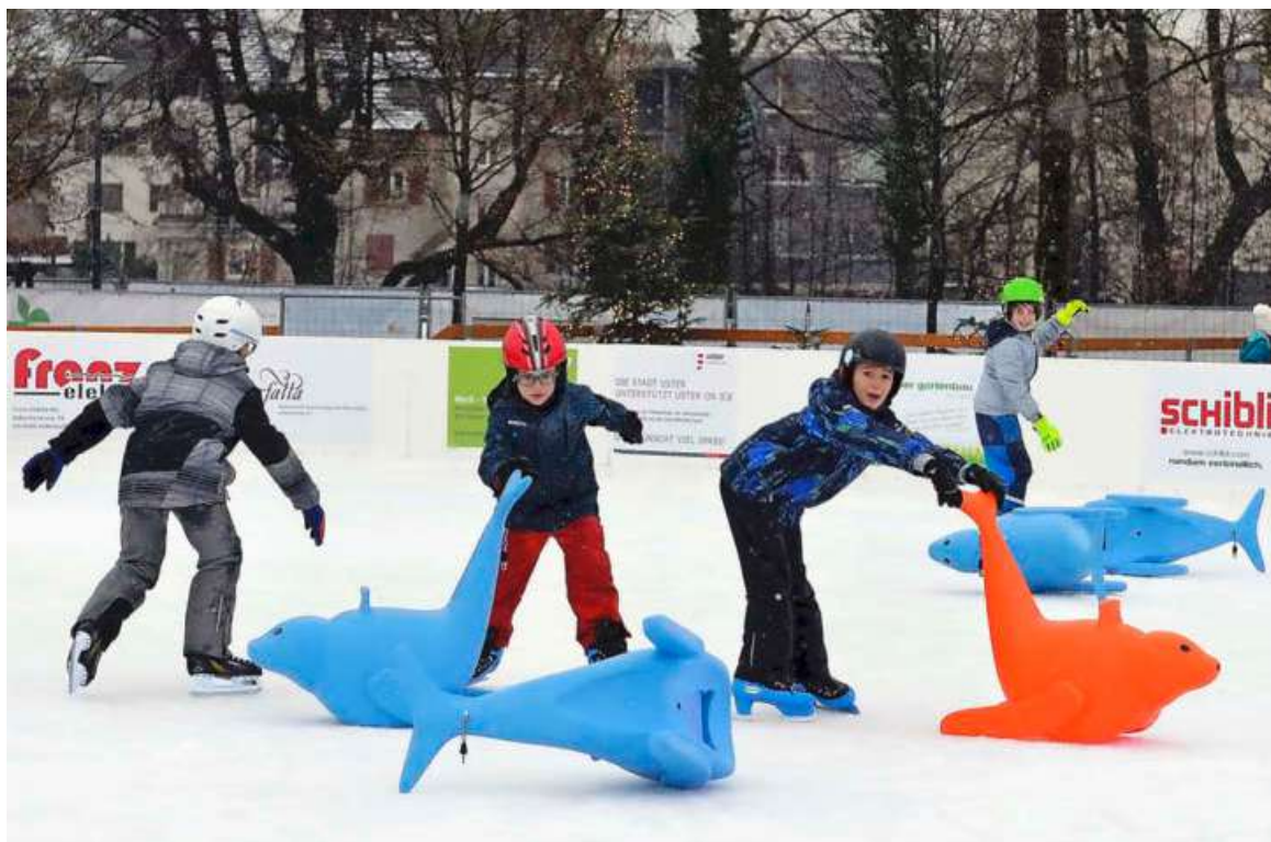
Das Eisfeld im Zentrum Usters lockte in den vergangenen Jahren jeweils viele Besucher an.